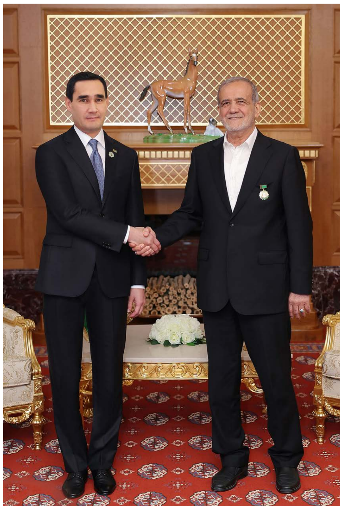
2024-nji ýylyň 11-nji okt. Berdimuhamedow ýurdumyzyň aýabrynda Prezident Serdar za iş sapary bilen gelen Eý-

ran Yslam Respublikasynyň kuk ýagdaýyndan ugur alyp, Guramasynyň, Ykdysady Prezidenti Masud Pezeşkian Eýran bilen dürli ugurlarda Hyzmatdaşlyk Guramasy bilen duşuşdy.